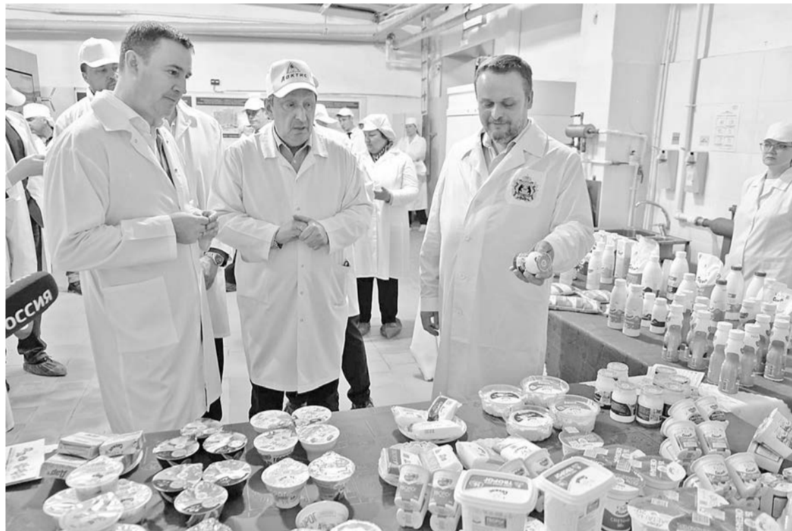
Одним из предприятий, на котором побывал глава Минсельхоза, стал холдинг «Лактис». Сегодня здесь производят более 150 видов молочной продукции.

Уровень освоения федеральных средств в Новгородской области выше среднероссийского, и в 2022 году объём господдержки для региона увеличили до 470 млн рублей. Андрей Никитин уточнил, что по итогам года Новгородчина по индексу производства должна выйти на 101%.